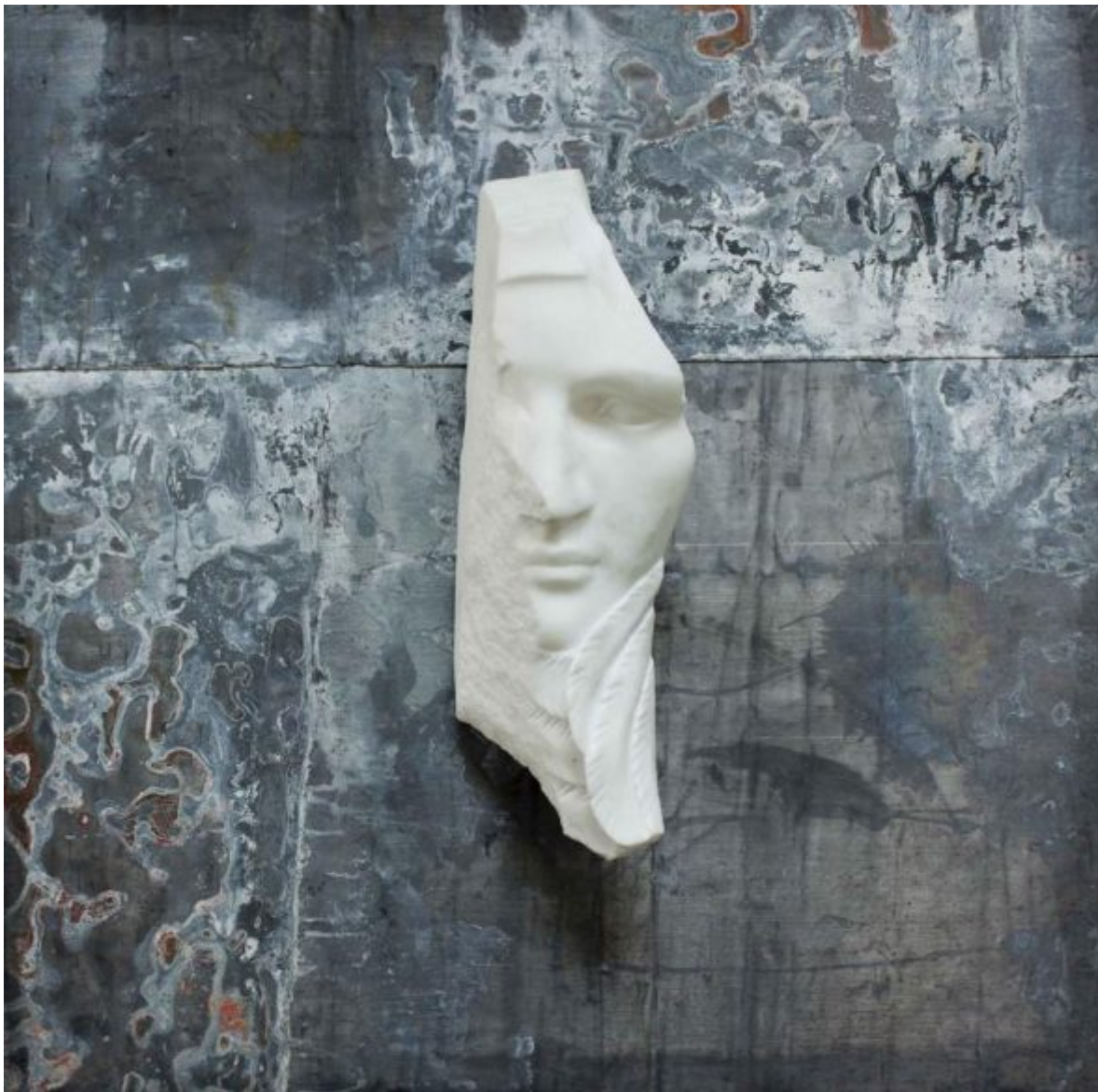
CONTINI Michelangelo Galliani, HYPHNOS, 2017, marmo statuario di Carrara e piombo, cm70x70cm

Un'intera area del padiglione 1 sarà dedicata alle opere in lizza per dare massima visibilità ai partecipanti del concorso, cui si aggiunge la seconda edizione del contest Show and Tell – Pensa Crea Mostra , riservato ad artisti, curatori, giovani collettivi Under 30: in palio c'è uno spazio espositivo gratuito per presentare in fiera il progetto