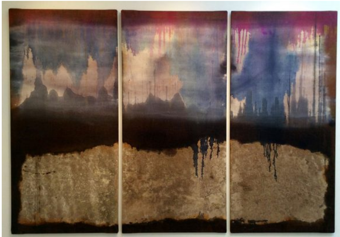
AXRT GALLERY TTozoi