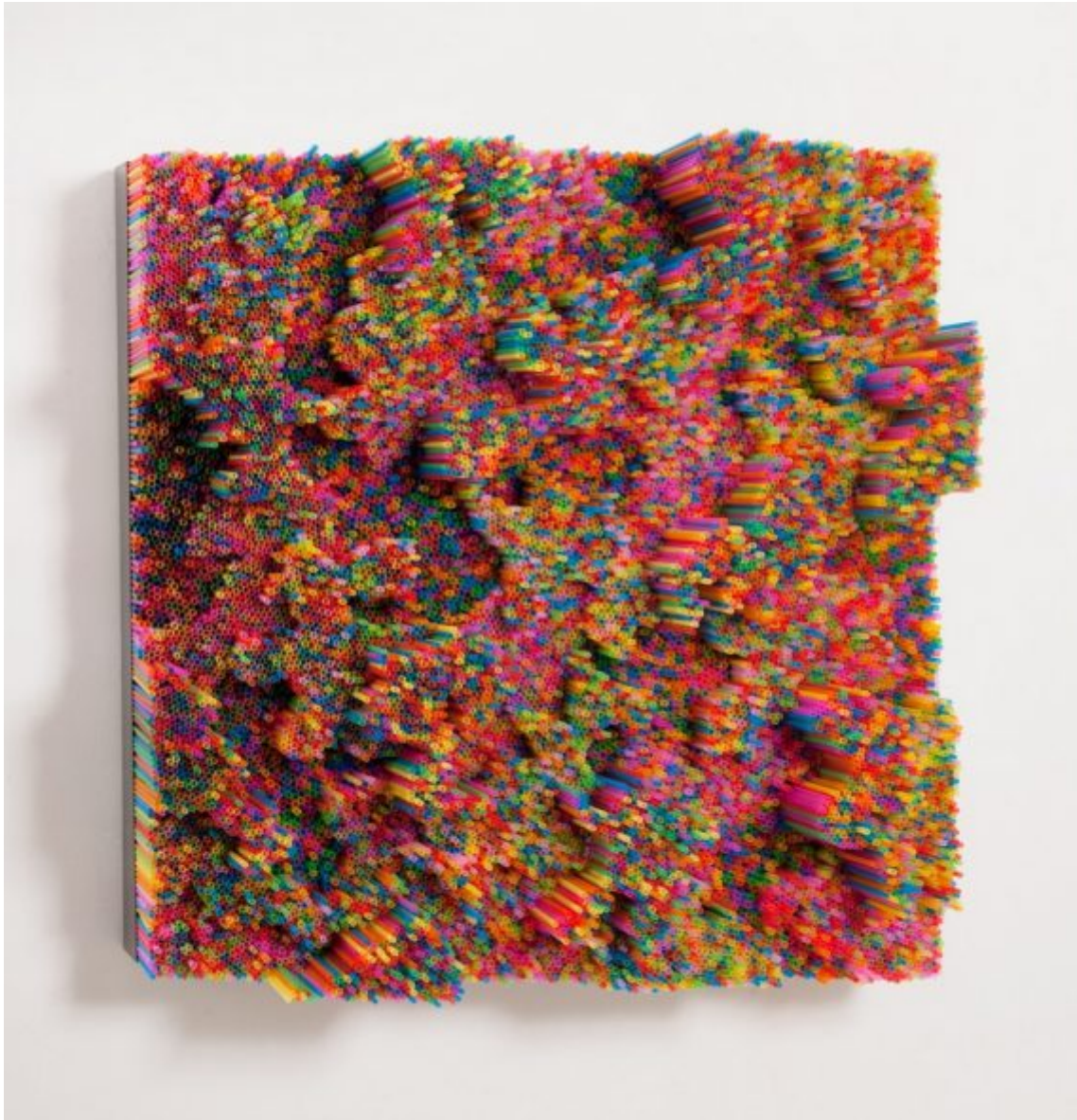
COLOSSI Francesca Pasquali_Multicolor straws