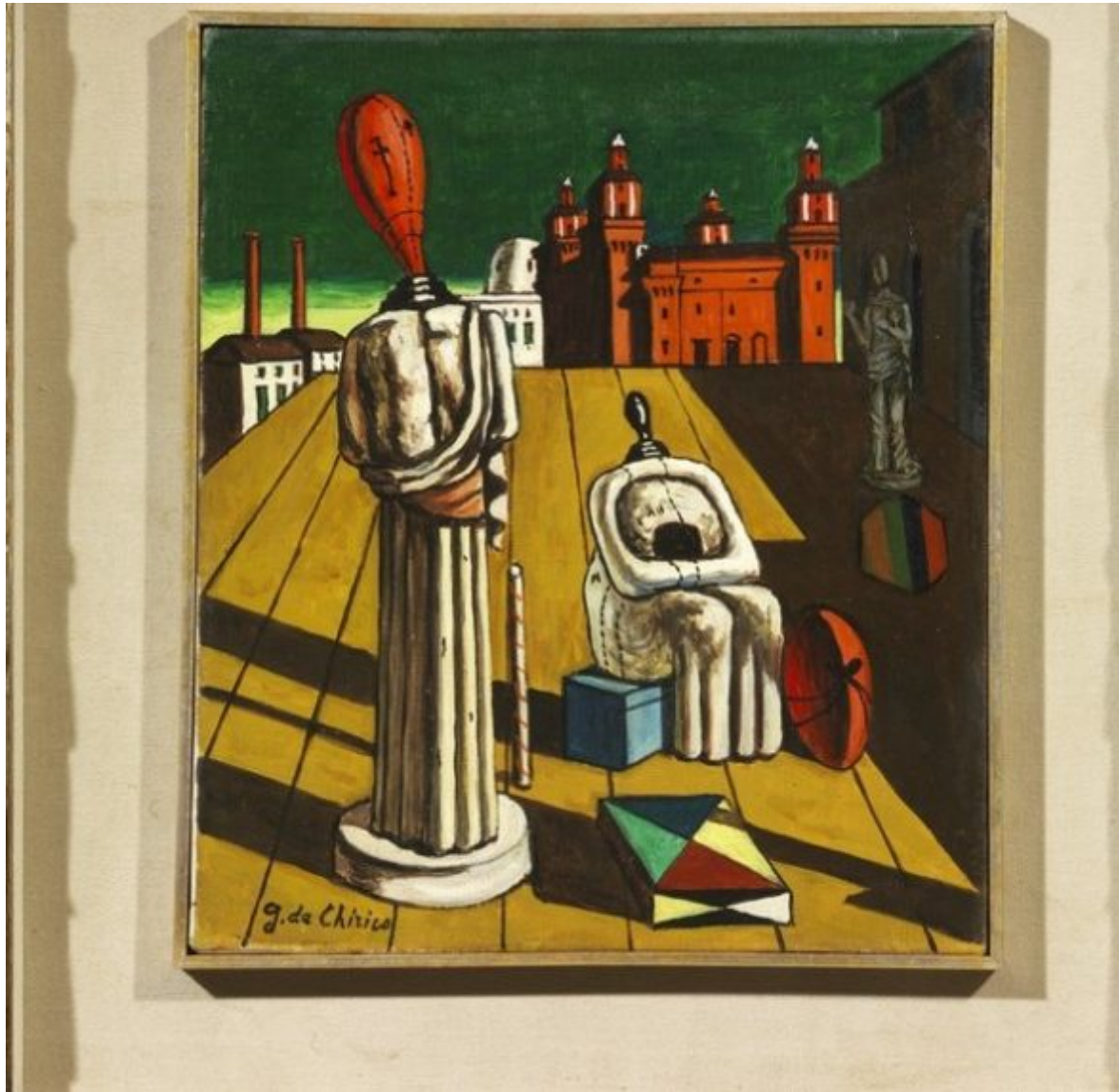
TORNABUONI De chirico le muse inquietanti 35×30